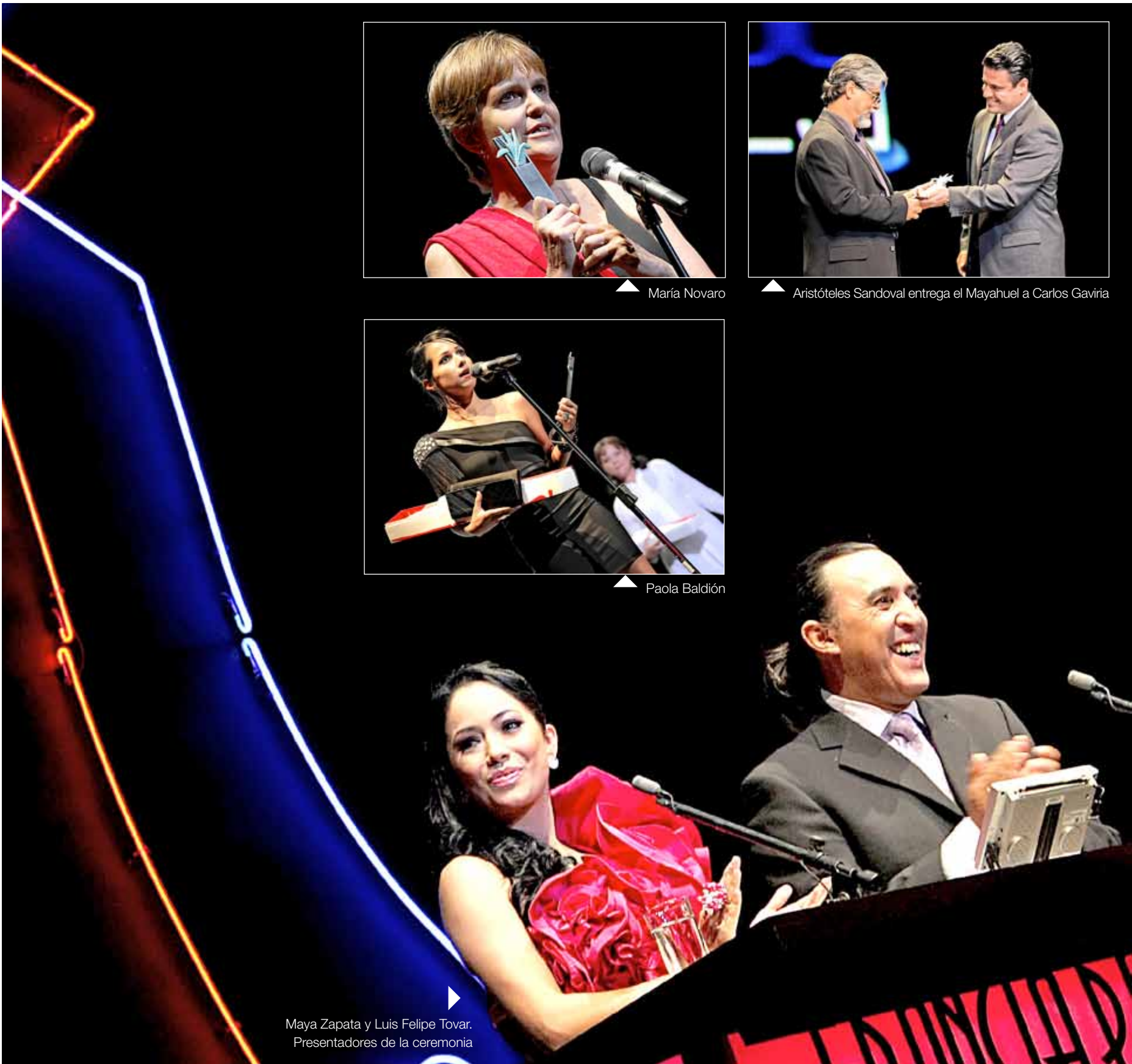
▲ María Novaro